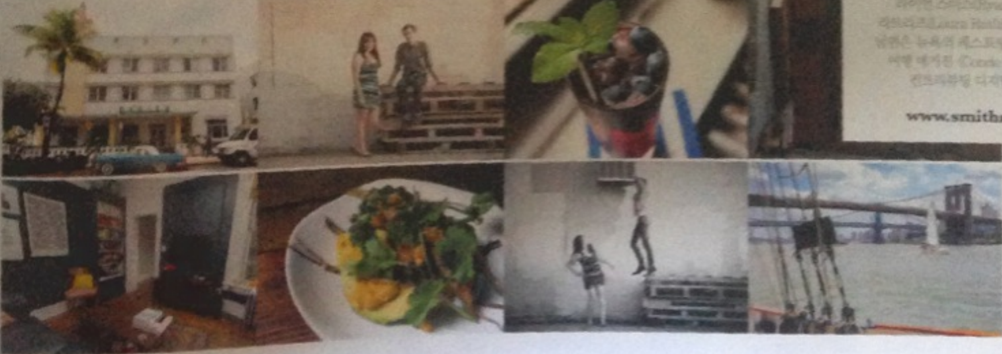
자신들의 집 거실부터 맨해튼의 맛집 음식들, 여행지까지 다양한 사진들.